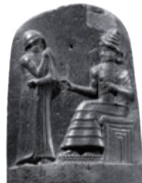
B Codice di Hammurabi.