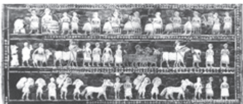
A Stendardo di Ur.

13 Una di queste importanti testimonianze storiche NON appartiene a una civiltà mesopotamica. Quale?