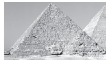
C Piramide di Cheope.

14 I primi pittogrammi che i Sumeri incisero sull'argilla si evolsero nei segni